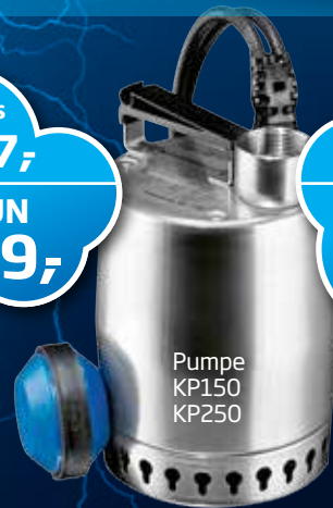
Regnvands- pumpe KP250-A1/10 Varenr. 012H2800