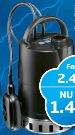
Drænpumpe CC7-A1 Varenr. 96280968