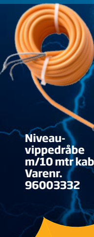
Niveau- vippedråbe m/10 mtr kabel Varenr. 96003332

Spar op til 42% på dræn - og regnvandspumper!